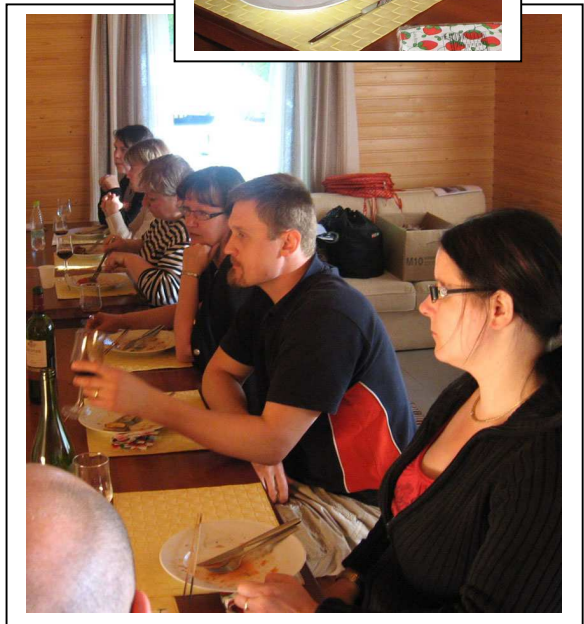
Kuvat ja sivujen teko: Seppo Heikkinen