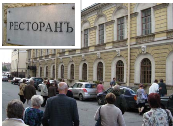
Tänne mentiin ruokaillemaan