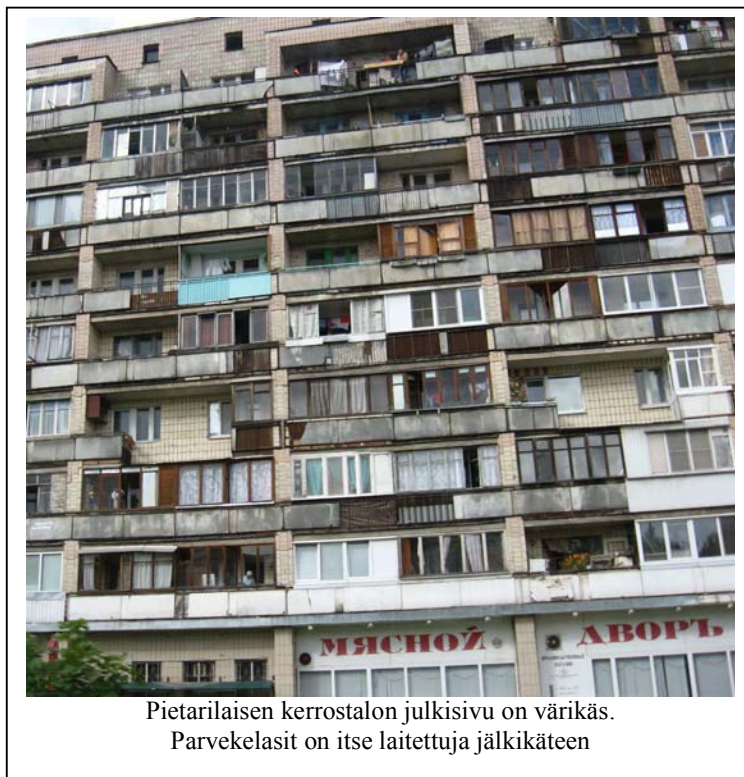
Pietarilaisen kerrostalon julkisivu on värikäs. Parvekelasit on itse laitettuja jälkikäteen