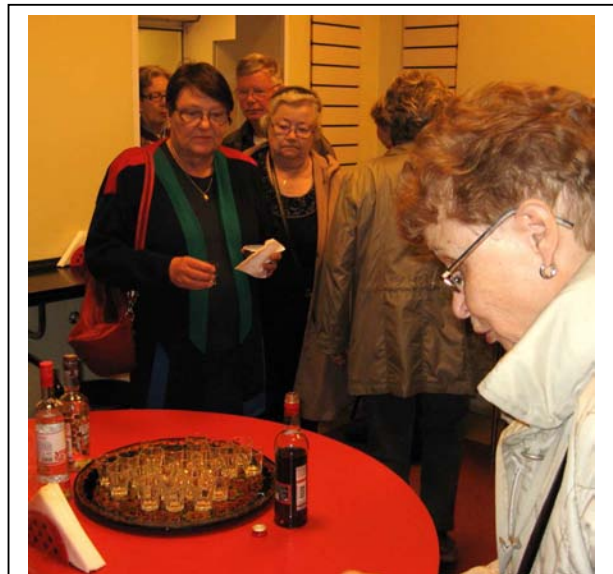
Alkoholiakin sai maistella takahuoneessa