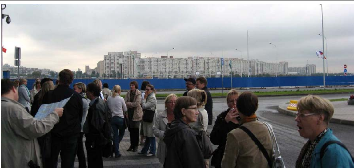
Tällainen ensinäkymä saatiin Pietarin suurkaupungista, kun astuimme laivasta maihin