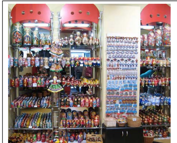
Paikallisia matkamuistoja oli tarjolla