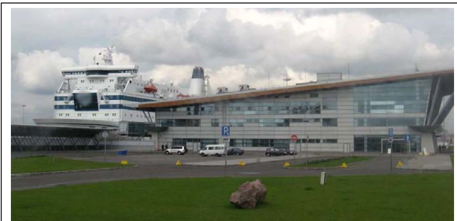
Pietarin uusi laivaterminaali on rakennettu tekosaarelle

Kuvat otti ja sivut teki: Seppo Heikkinen