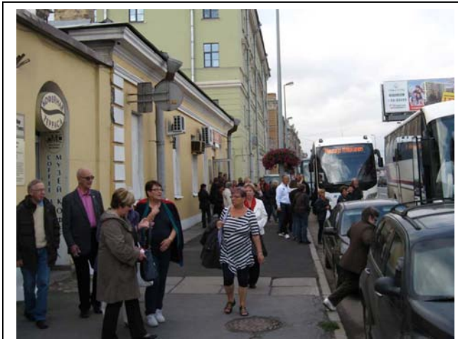
Opas vei meidät pietarilaiseen ”perjuskaan”