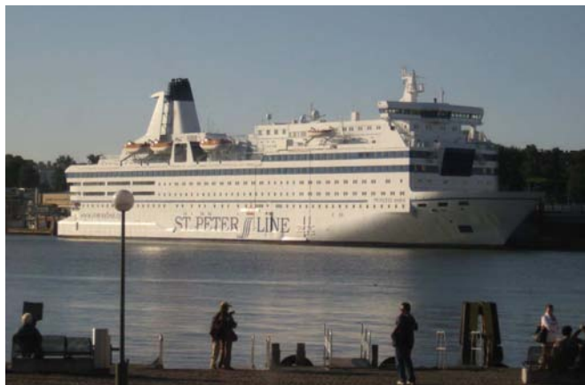
Pietarin risteilijä Princess Maria Helsingin eteläsatamassa