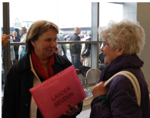
Venäläinen opas, joka puhui sujuvaa Suomea, oli vastassa Pietarin satamaterminalissa