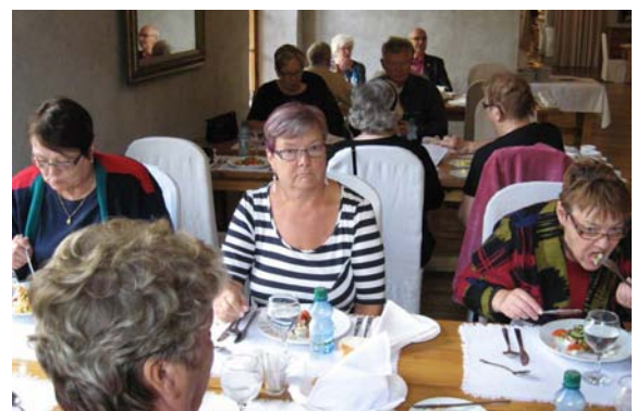
Ruoka maistui venäläisessä ravintolassa