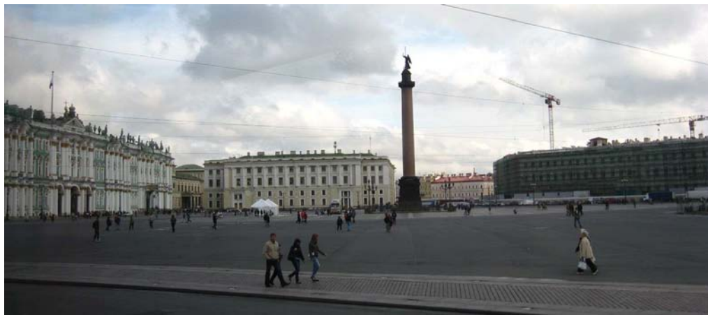
Talvipalatsin edustaa. Täällä sijaitsee Eremitaasi, joka on yksi maailman suurimmista museoista